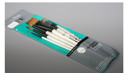
Pochette 6 pinceaux: 9,90€